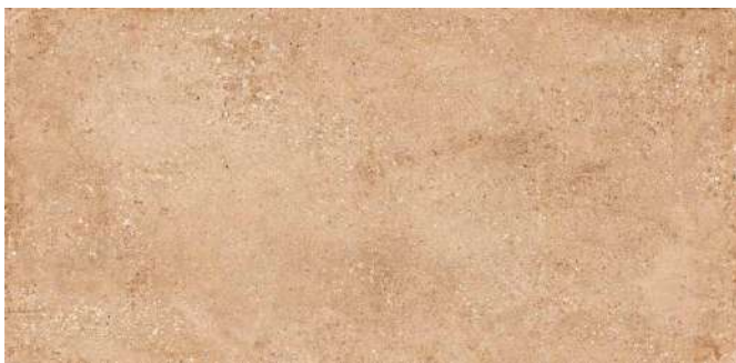
LANDSCAPE COTTO | IV | R 10/B | Farb-Nr. 091