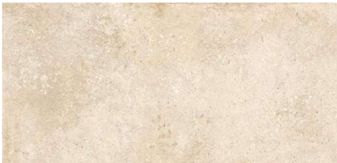
LANDSCAPE SAND | IV | R 10/B | Farb-Nr. 090