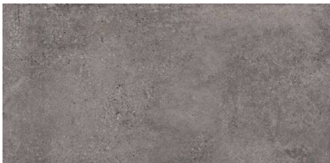
LANDSCAPE GRAPHIT* | IV | R 10/B | Farb-Nr. 093