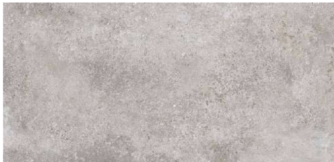
LANDSCAPE KIESEL | IV | R 10/B | Farb-Nr. 092